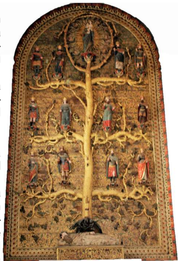
Árbol de Jesé

No habrá daño ni estrago por todo mi Monte Santo porque está lleno el país de la ciencia del Señor, como las aguas colman el mar. Aquel día la raíz de Jesé se erguirá como enseña de los pueblos, la buscarán los gentiles y será gloriosa su morada.