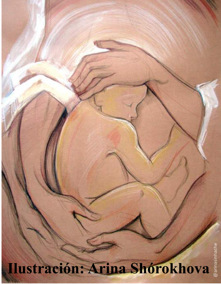
Ilustración: Arina Shórokhova

Gracias a estos jóvenes y a José Ángel, Rector del Seminario que atiende el turno, seguimos manteniendo las vigili- as del turno juvenil. En 2017 seguiremos intentando con la ayuda del Señor que el turno se vaya nutriendo con nuevas incorporaciones y para ello hemos trasladado las vigili- as a la Iglesia de San Marcos. Ánimo contáis con el apoyo y las oraciones de todos los adoradores.