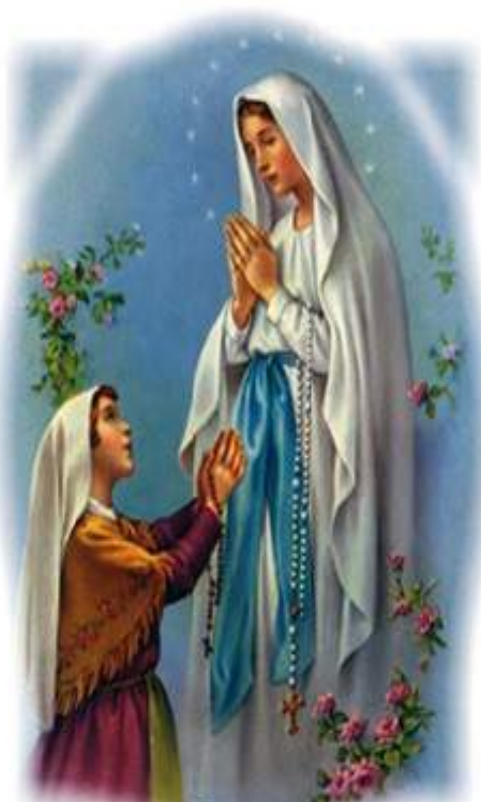
NUESTRA SEÑORA DE LOURDES